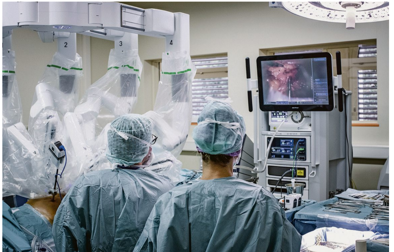
Nach einer Vorgabe des Bundes werden gewisse Operationen nur noch ambulant durchgeführt.

Die Liste des Bundes ist wohl nur der Anfang. Nach einem Monitoring über deren Wirkung will das Bundesamt für Gesundheit über einen Ausbau der Liste entscheiden. Einige Kantone gehen schon jetzt weiter und haben bis zu sechzehn Eingriffe auf die Liste gesetzt. Vorreiter dieser Entwicklung war die Romandie. Dort hat man schon vor Jahren mit der Umstellung begonnen. Sollte die einheitliche Finanzierung von ambulanten und stationären Eingriffen im Parla-