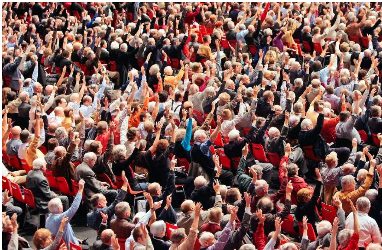
Egal, wie viele Aktionäre im Saal sitzen, gegen das Gewicht der Stimmrechtsberater haben sie keine Chance.

Regulatorische Zwänge haben die Verbreitung der Stimmrechtsberater beschleunigt. In den USA sind Pensionskassen seit den Achtzigerjahren und Fonds-